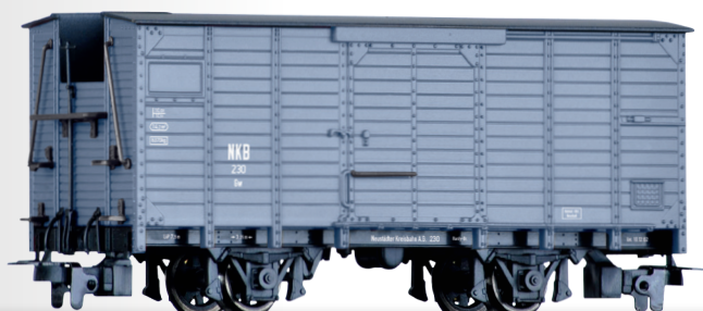
Gedeckter Güterwagen Gw der NKB Box car Gw of the NKB