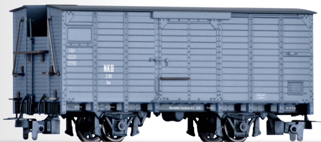
Gedeckter Güterwagen Gw der NKB Box car Gw of the NKB