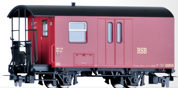
Packwagen KDaai der HSB Baggage car KDaai of the HSB