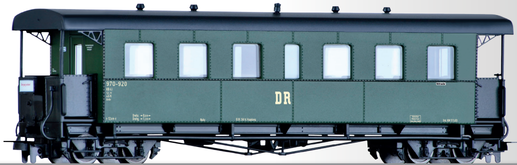
Personenwagenset der DR, bestehend aus zwei Personenwagen KB4i Passenger coach set of the DR with two passenger coaches KB4i